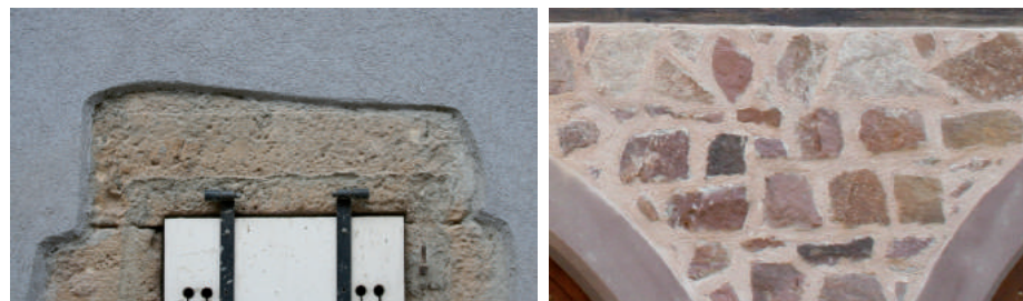
Les contours et les ouvrages irréguliers ne sont pas conformes aux styles historiques.