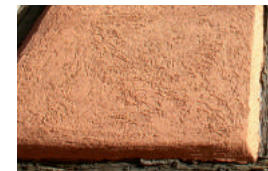
Les crépis modernes talochés rugueux ne sont pas adaptés au bâti ancien, notamment aux maisons à colombages.

Un grand choix de teintes est utilisable pour les enduits. Cependant, dans tous les cas, ces teintes doivent être en harmonie avec les éléments naturels des constructions. Les tons sable, les ocres et les tons pierre claire conviennent dans la plupart des cas.