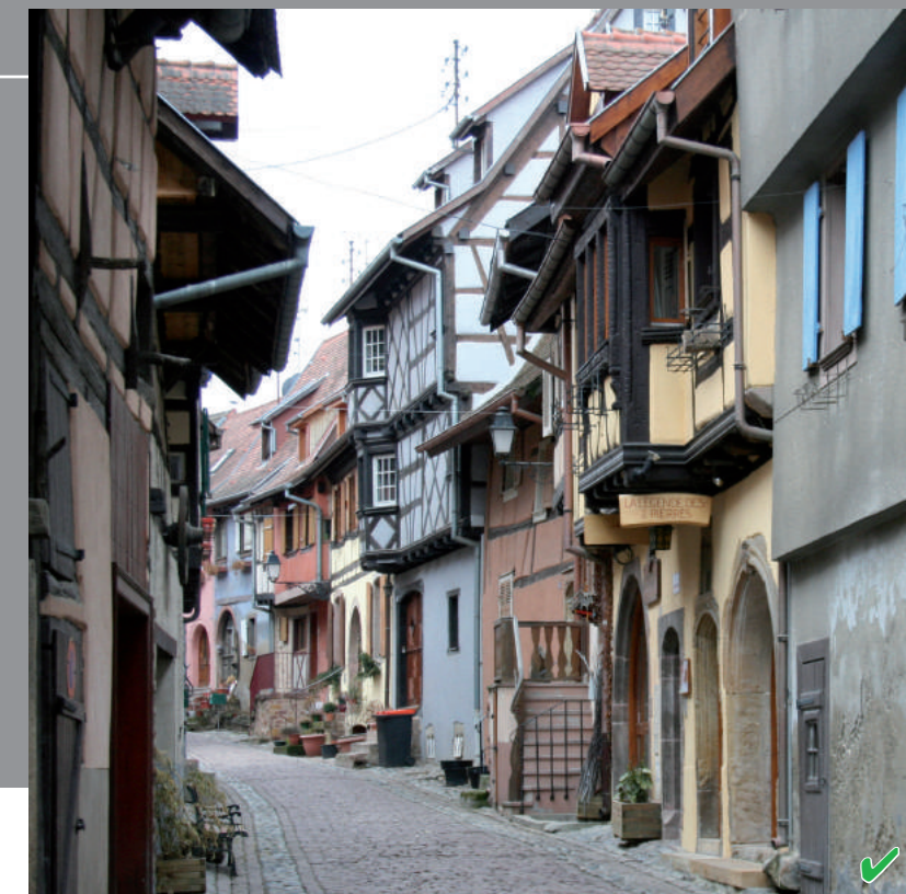
Cette ruelle du rempart Nord présente la simplicité d'un bâti traditionnel.