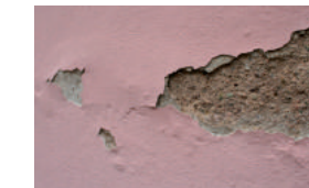
Les peintures et crépis plastiques (acryliques), trop étanches, se décollent sous la pression de l'eau contenue dans le mur.

L'une des principales caractéristiques d'un revêtement mural est sa porosité, c'est-à-dire sa capacité à favoriser l'évaporation de l'humidité contenue dans un mur. Les produits à base de chaux ou de silicates possèdent ces qualités. Les peintures minérales sont particulièrement adaptées aux constructions anciennes d'Eguisheim.