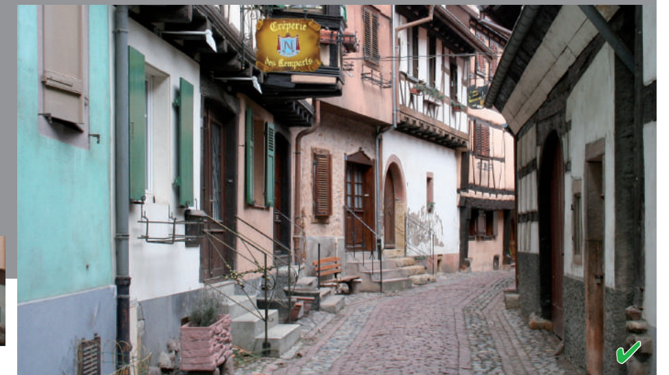
Le soubassement doit préserver la façade de la saleté et favoriser l'évaporation de l'humidité remontant du sous-sol. S'il est recouvert d'un revêtement étanche et robuste, l'eau cherchera une issue plus haut en rompant le crépi ou la peinture de la façade.