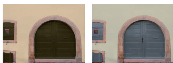
Exemples de colorations : simulations

Les volets peuvent être peints en vert, bleu, brun-rouge, gris, brun ou blanc cassé.